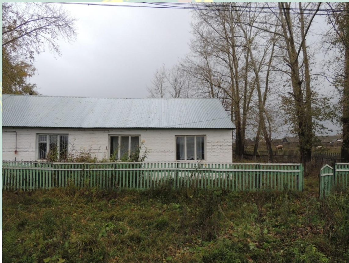
Рис.4 Школа Маломусино