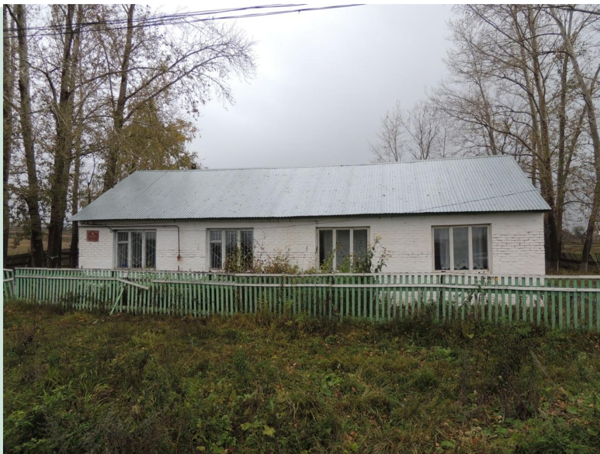
Рис.3 Школа Маломусино