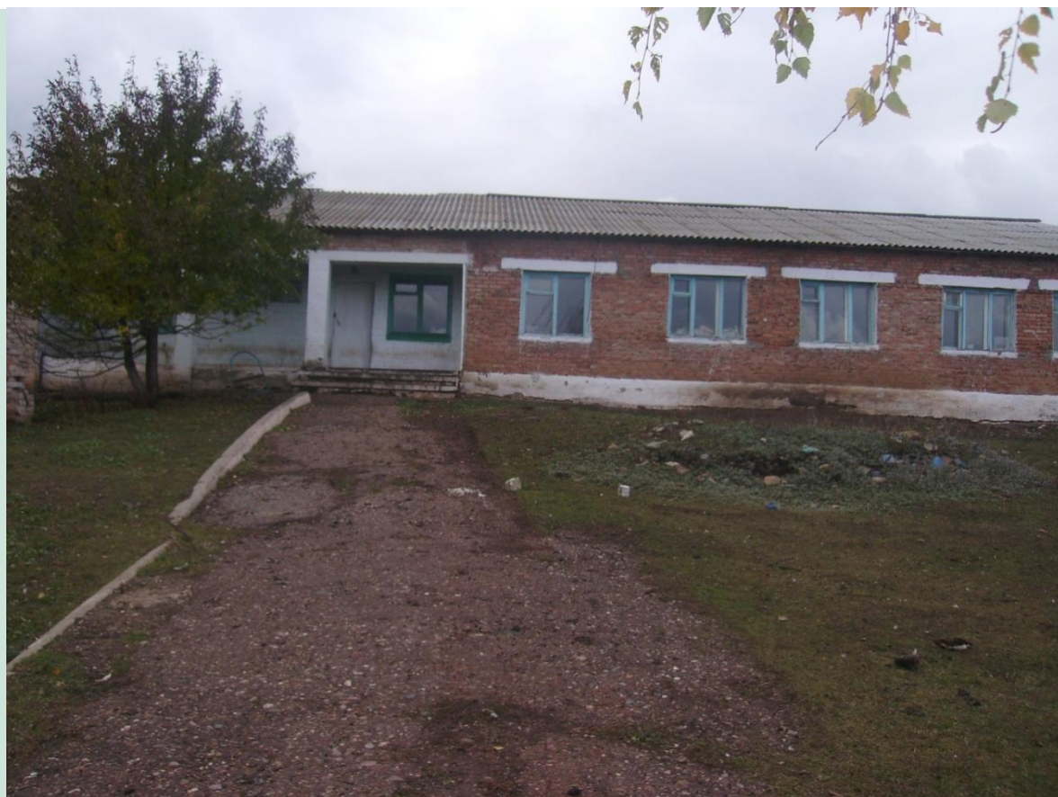
Рис. 7 - Куюргазинский район здание конторы с.Свобода