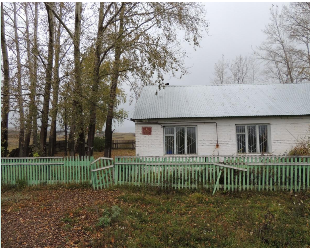
Рис.23 - ФАП