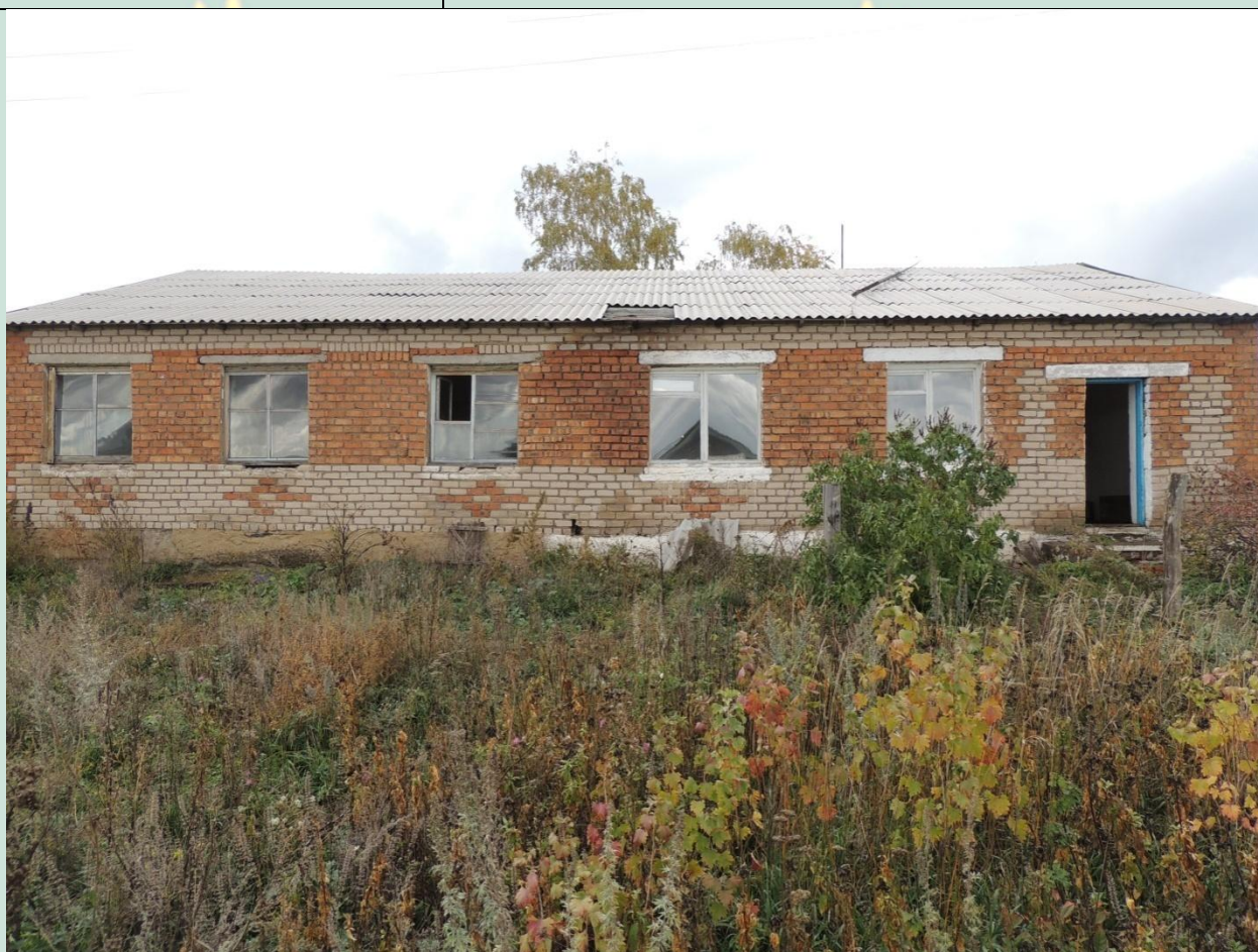
Рис.1 Школа Красный Маяк