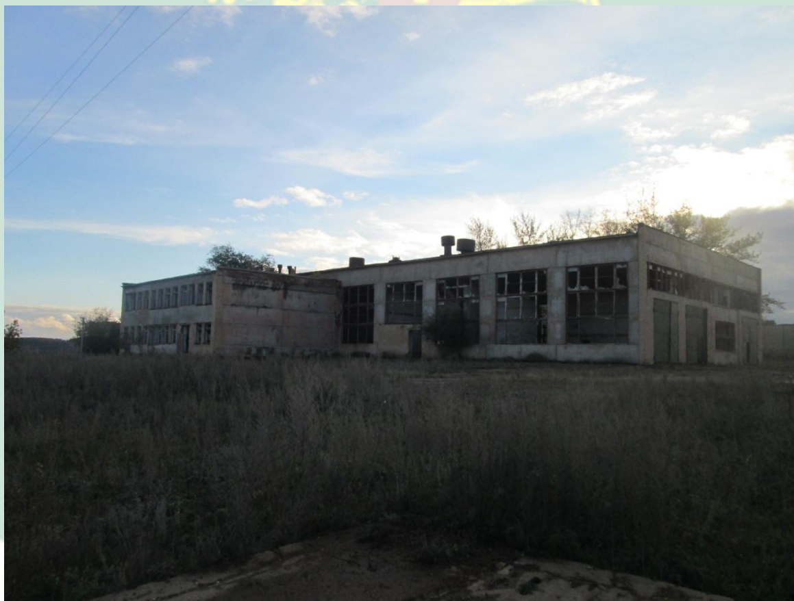
Рис. 12 - Куюргазинский район с.Свобода здание мастер