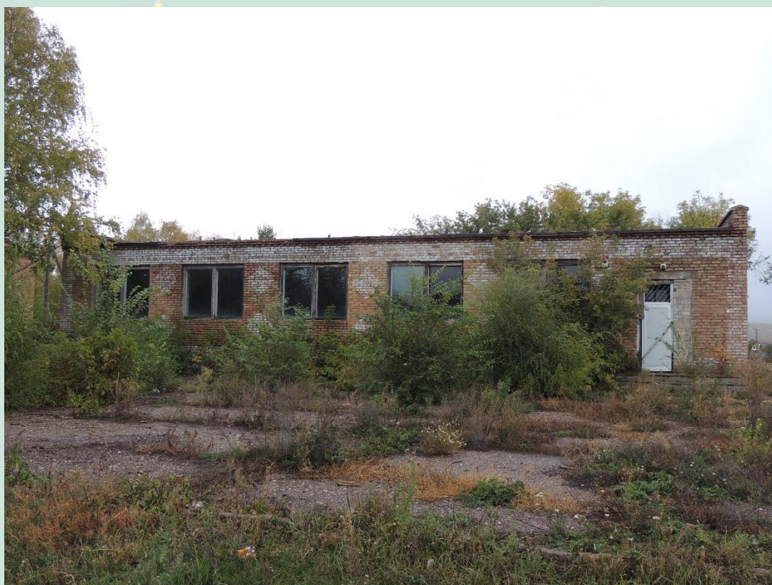
Рис. 10 - Куюргазинский район магазин с.Бугульчан