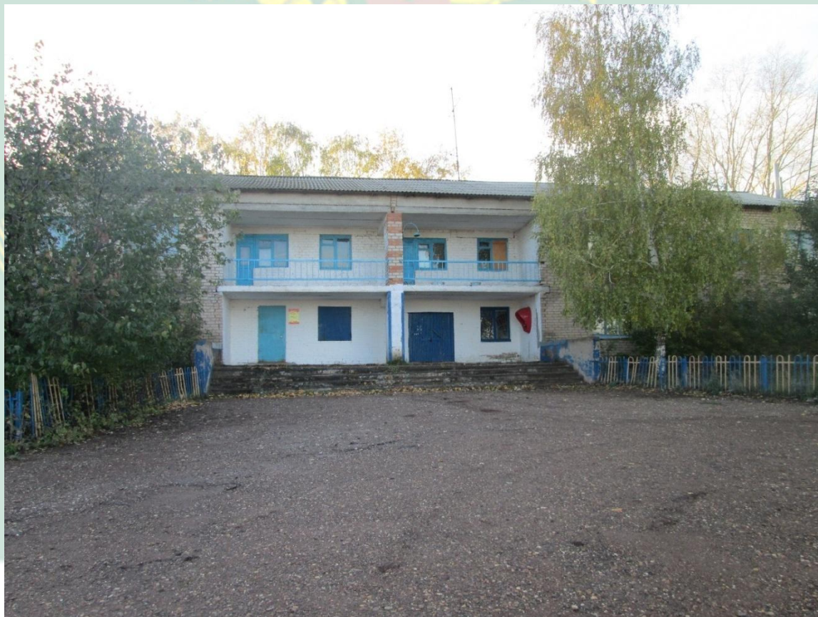
Рис.5 - Куюргазинский район здание школы д.Тюканово