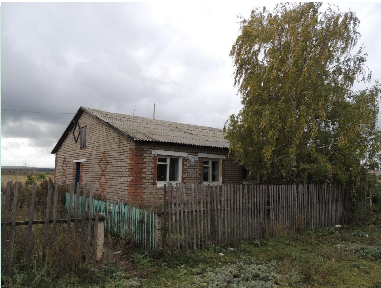
Рис.2 Школа Красный Маяк