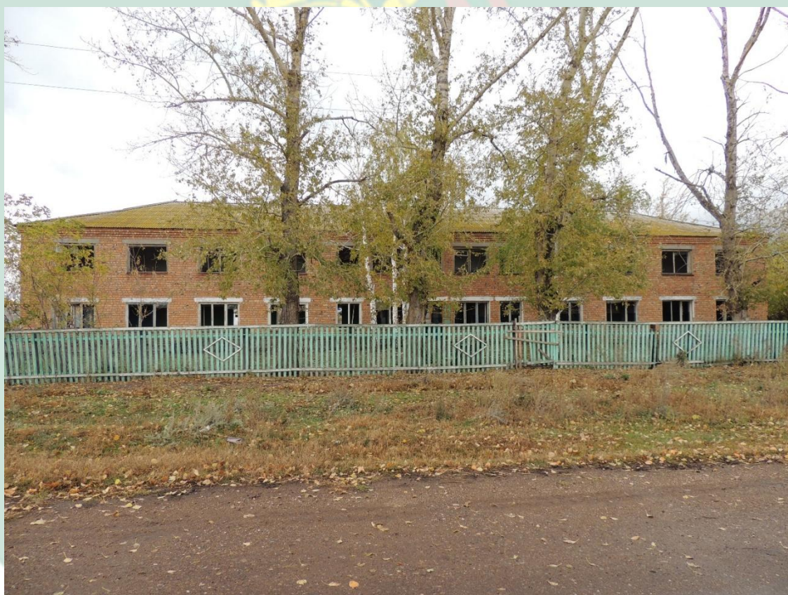
Рис. 17 - Здание интерната