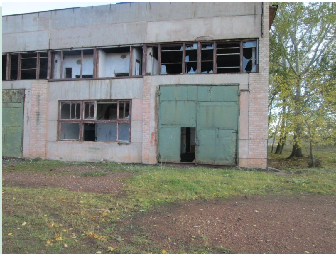
Рис. 11 - Куюргазинский район с.Свобода здание мастер