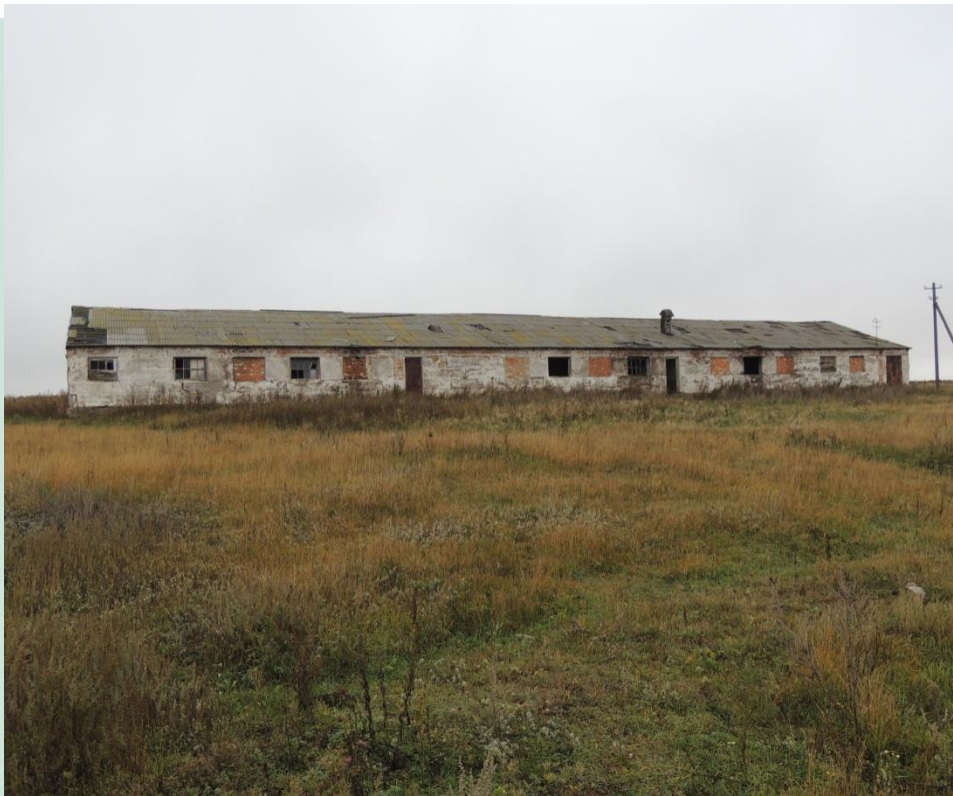
Рис.21 - Ферма1