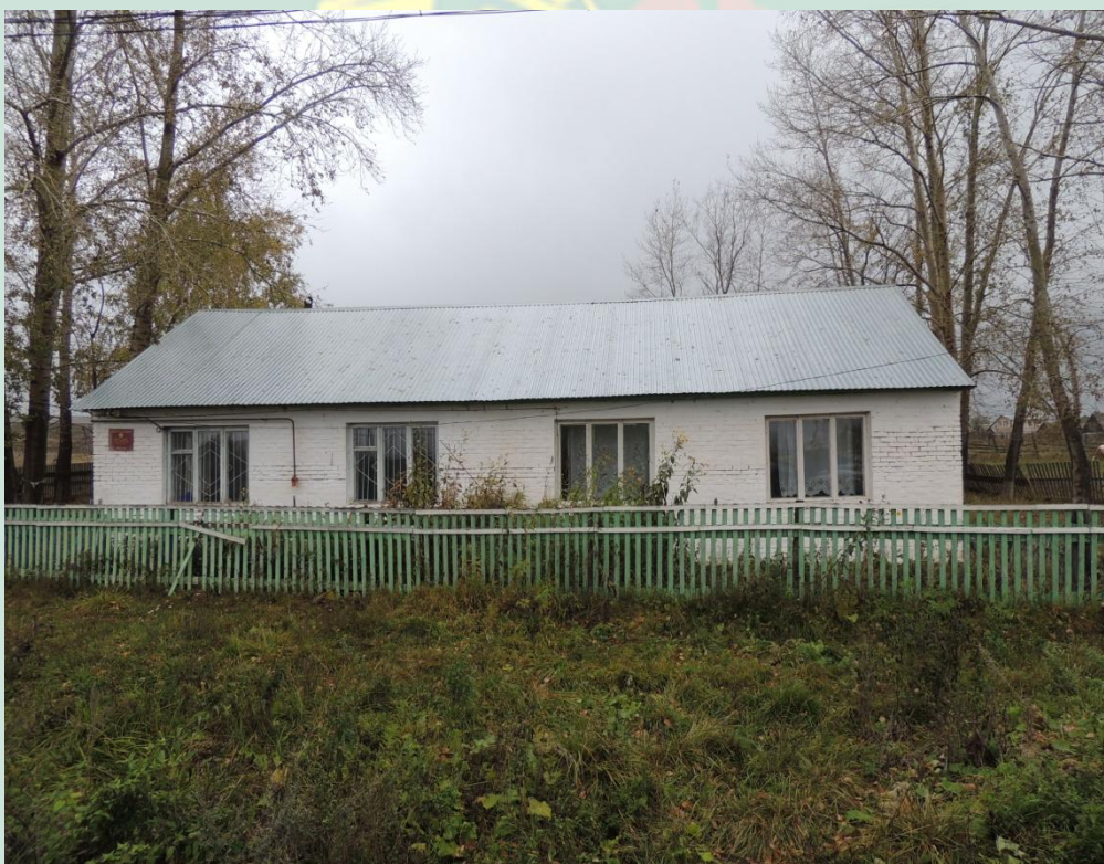
Рис.24 - ФАП.1