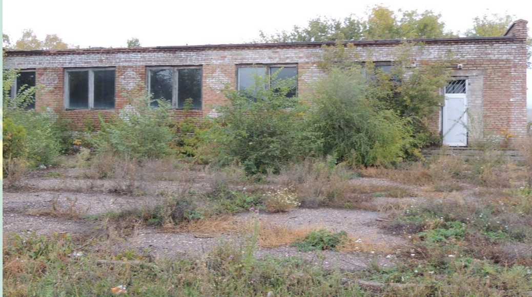
Рис. 9 – Куюргазинский район магазин с.Бугульчан