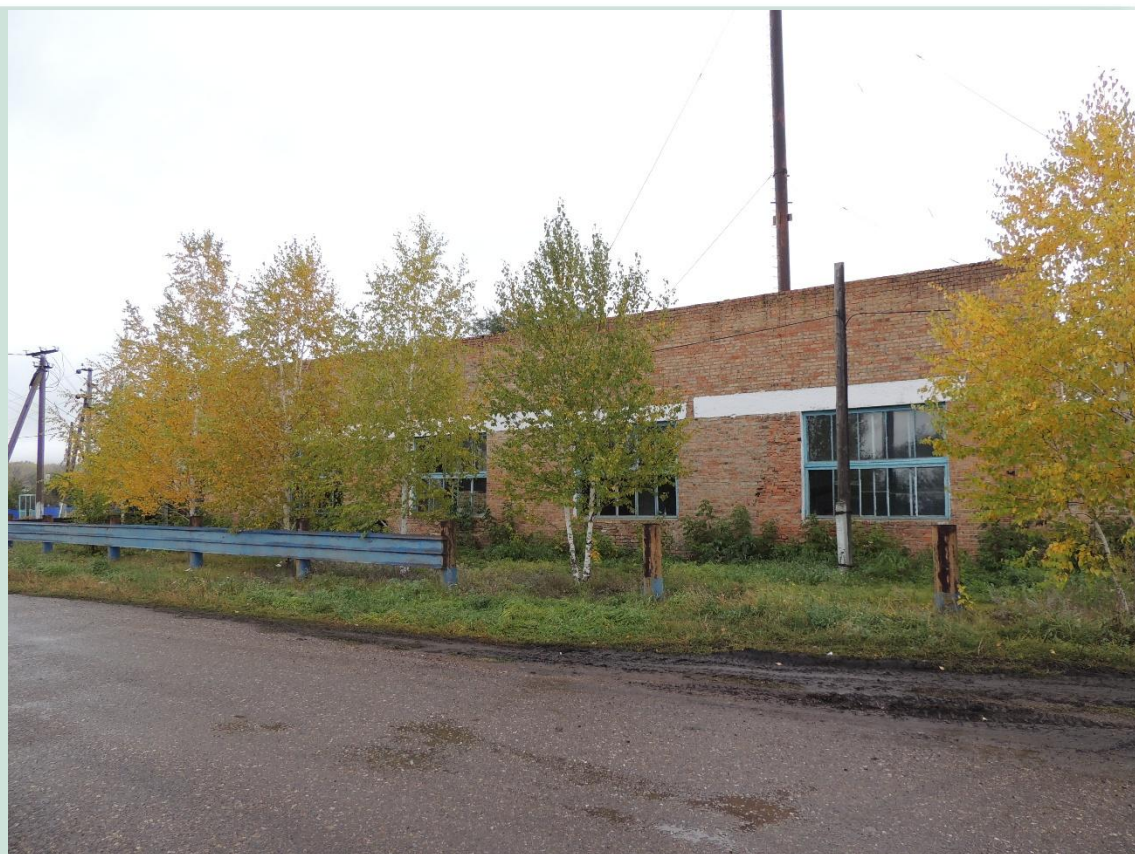
Рис. 19 - Центральная котельная