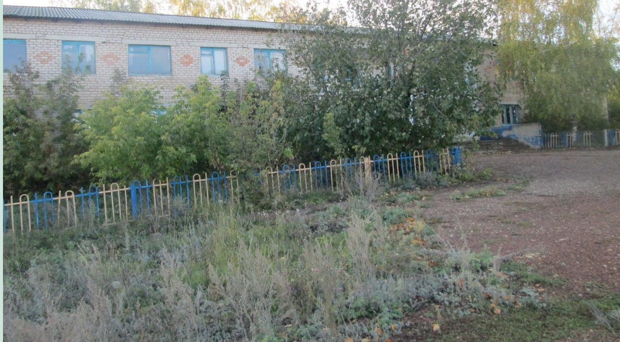
Рис. 6 - Куюргазинский район здание школы д.Тюканово