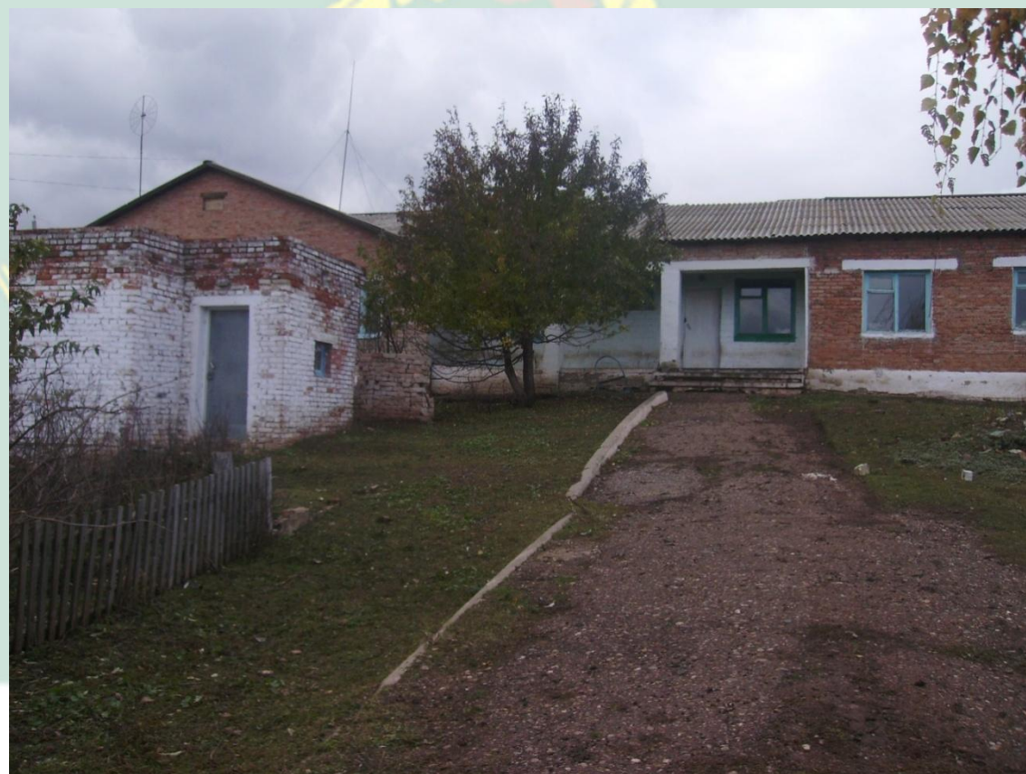
Рис.8 - Куюргазинский район здание конторы с.Свобода