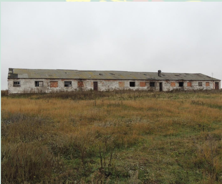
Рис. 22 - Ферма